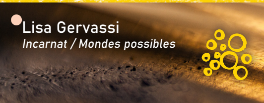
● Lisa Gervassi Incarnat / Mondes possibles