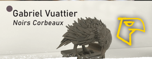
● Gabriel Vuattier Noirs Corbeaux