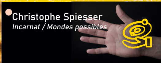
● Christophe Spiesser Incarnat / Mondes possibles