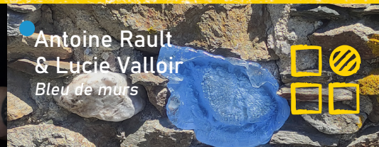
● Antoine Rault & Lucie Valloir Bleu de murs