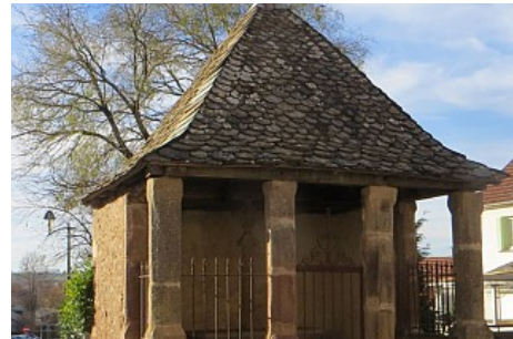
Oratoire de Ceignac