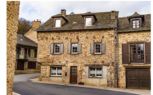
Calmont de Plancatge