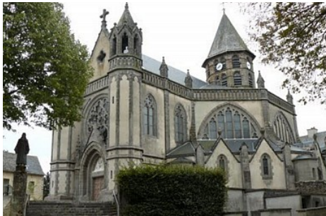
Basilique de Ceignac

L'oratoire du XVIe siècle abritant une croix classée et de la halle du XVe siècle juste à côté de la basilique.