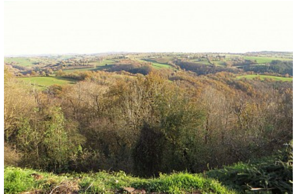
Vue sur la vallée