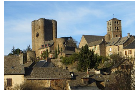
Calmont de Plancatge