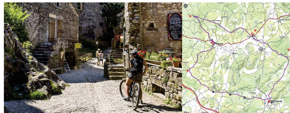
Le village templier de La Couvertoirade

Des Gorges du Tarn au Causse du Larzac - La Couvertoirade